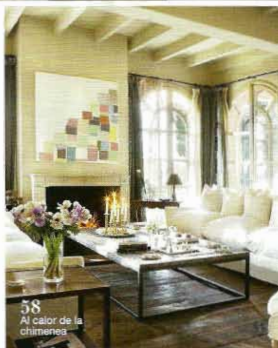
58 Al calor de la chimenea

148 Lo que viene. Novedades del mundo de la decoración