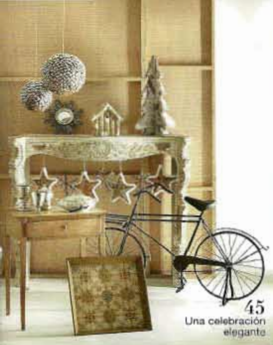
45 Una celebración elegante