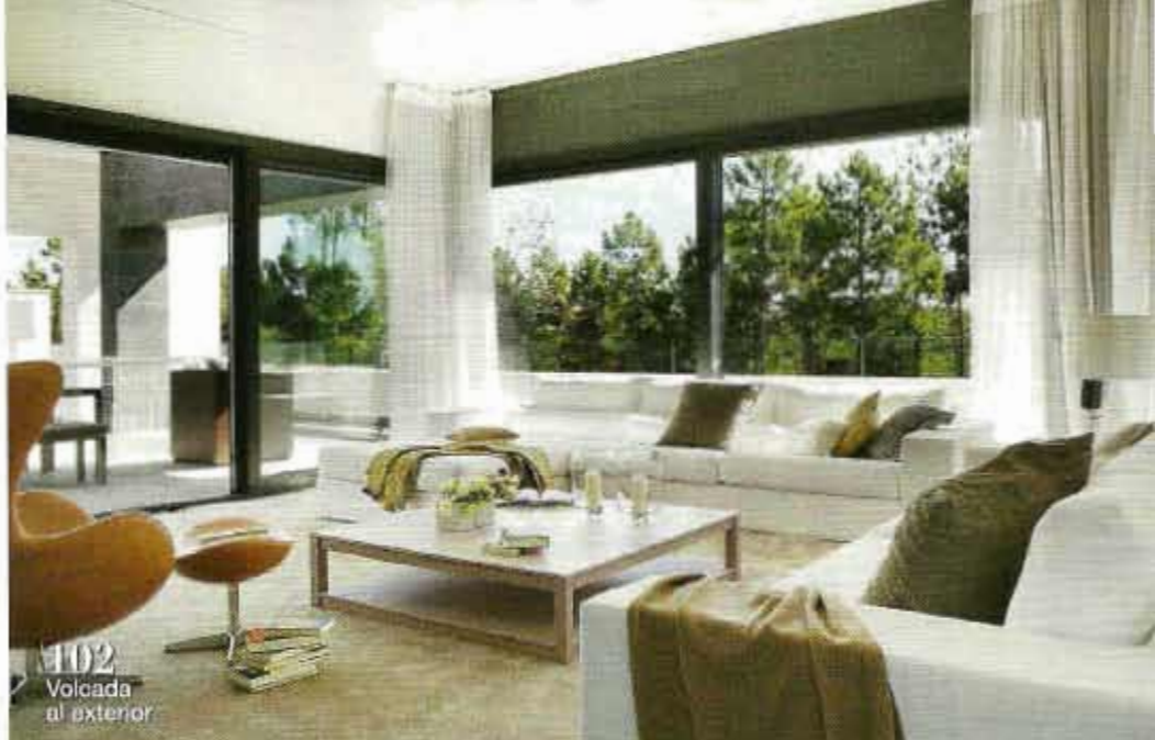
102 Volcada al exterior

116 La belleza natural de la madera. Parqués de variados materiales, acabados y sistemas de instalación